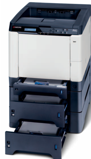
Produkt je zobrazen včetně volitelných doplňků.