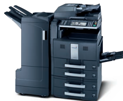
Výrobek je zobrazen včetně volitelných doplňků.