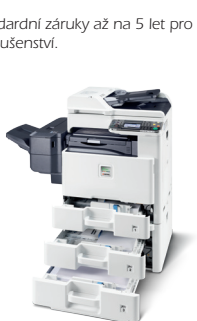
Produkt je zobrazen včetně volitelných doplňků.