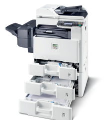
Produkt je zobrazen včetně volitelných doplňků.